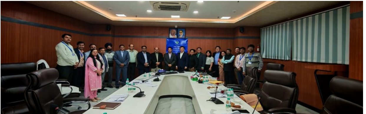
उत्तर प्रदेश ग्रामीण बैंक, लखनऊ को विजिट